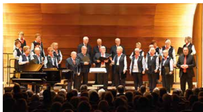
gemischter Chor der Hamburger Hochbahn