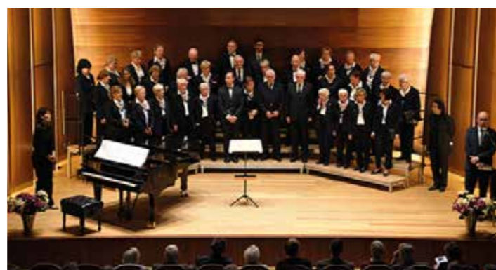
Chor des Lufthansa SV