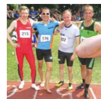
Vier Hamburger Sprinter