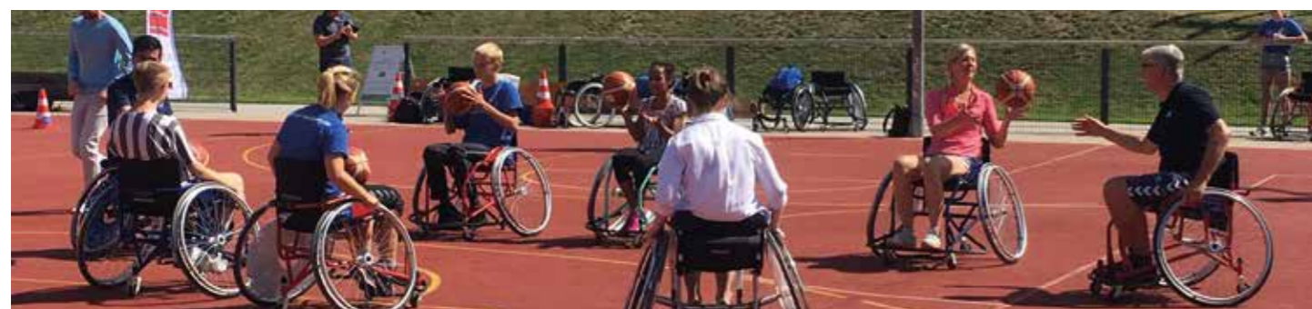
Warm Up im Rollstuhl