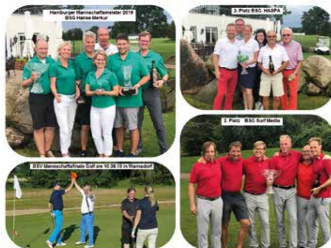
Alle Sieger der Hamburger Meisterschaft im Golf 2019