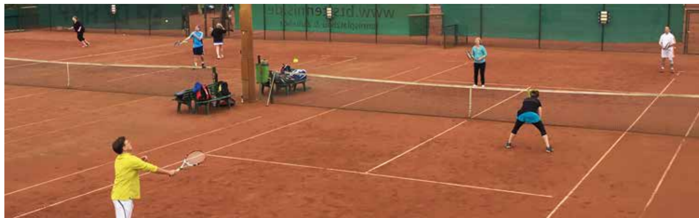
Mixed Turnier auf der Anlage des BSVs an der Wendenstraße

wir auf bsv-hamburg.de/tennis aufgeführt. Bilder und aktuelles vom weißen Sport findet man nun auch auf facebook/bsvhamburgtennis