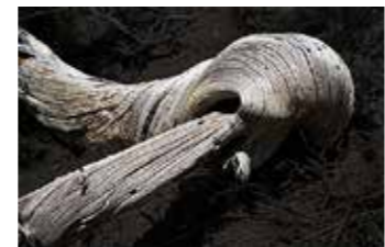
Kategorie Papier: 2. Platz Farbe, Wilfried Drobek „verwunden“