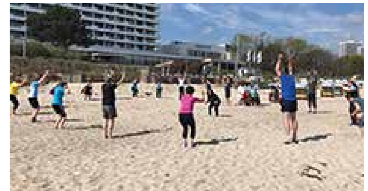
Workout am Strand

Nach dem reichhaltigen Frühstück ging es zum Walken oder Joggen an den Ostseestrand. Jeder konnte das machen, was sein Fitnesslevel hergab. Wichtig war nur, dass wir in Bewegung blieben. Am verabredeten Zielpunkt kamen alle wieder zusammen und wir wurden mit einzelnen Koordinationsübungen im Sand noch einmal gefordert. Im Anschluss gab es eine Erholungszeit, viele nutzten es für ein kurzes Schläfchen, andere gingen shoppen oder relaxten am Strand oder im Wellnessbereich des Hotels.