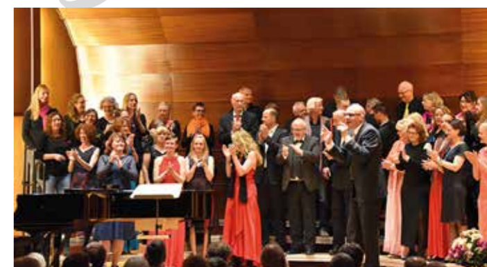
Gemeinsamer Auftritt der Chöre TKantate und Ottoneans