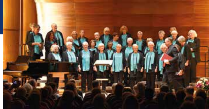
Frauenchor musica mundi