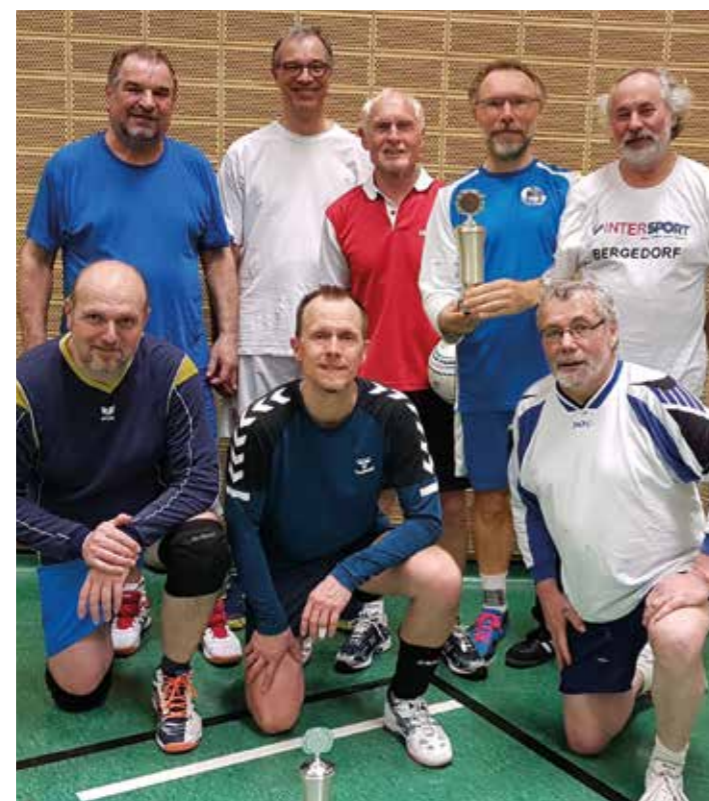
Faustball Senioren Pokalrunde 2019

FAUSTBALL ] Am 3.4.2019 trafen sich die Faustballer der Seniorenpunktspiele zum traditionellen Pokalturnier in der ERGO sports Halle.